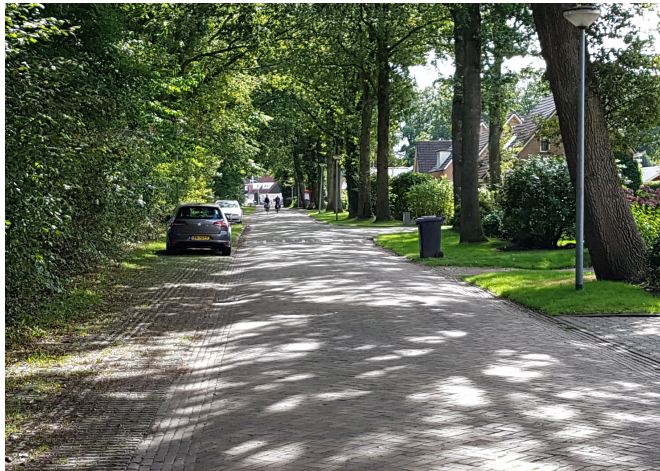
e) rijweg deels in gras, parkeren op grasbetonstroken, ruimte voor bomen, geen stoep, woonerf