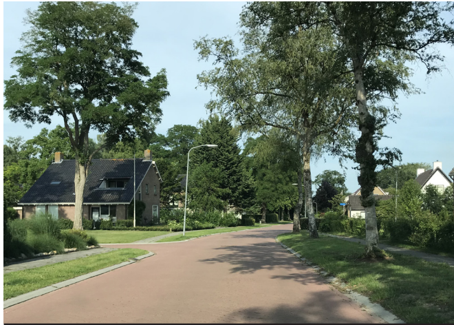
b) rijweg met band, parkeren op eigen erf of in parkeercoffers, vrijliggende stoep aan beide zijden, privétuin, ruimte voor bomen, lagere dichtheid