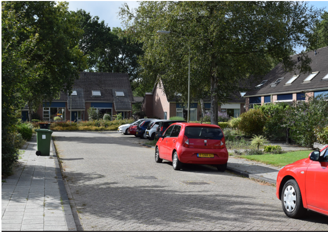
a) rijweg van betonklinkers met parkeren op straat, stoep aan beide zijden, grotere dichtheid kavels met privétuin