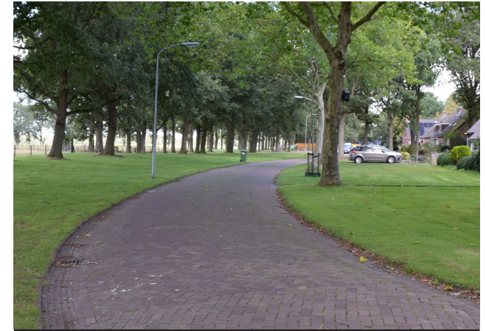
c) rijweg in het gras, parkeren op eigen erf of in parkeercoffers, geen stoep (woonerf), publieke tuin/volkstuin, landschappelijk wonen