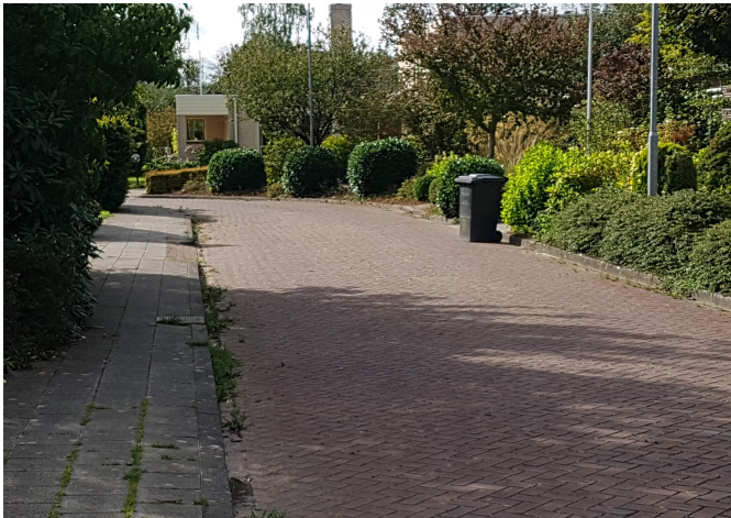
d) Smal wegprofiel, eenzijdige stoep, parkeren op eigen erf of in parkeercoffer, grotere dichtheid kavels, overwegend wel vrijstaand met privétuin