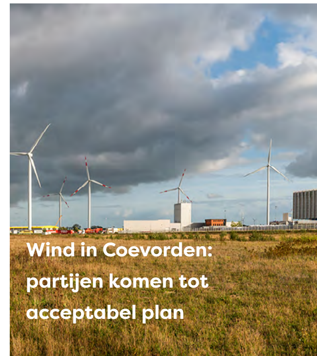
Wind in Coevorden: partijen komen tot acceptabel plan