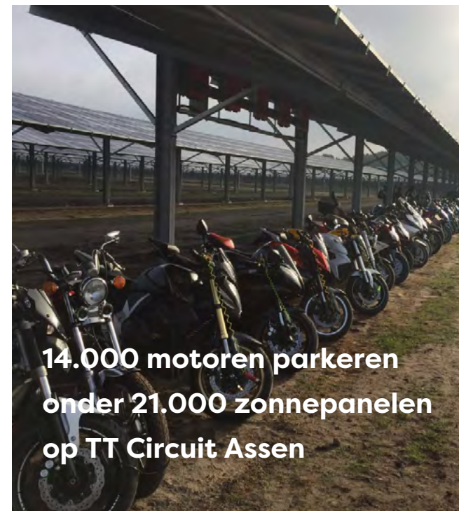
14.000 motoren parkeren onder 21.000 zonnepanelen op TT Circuit Assen