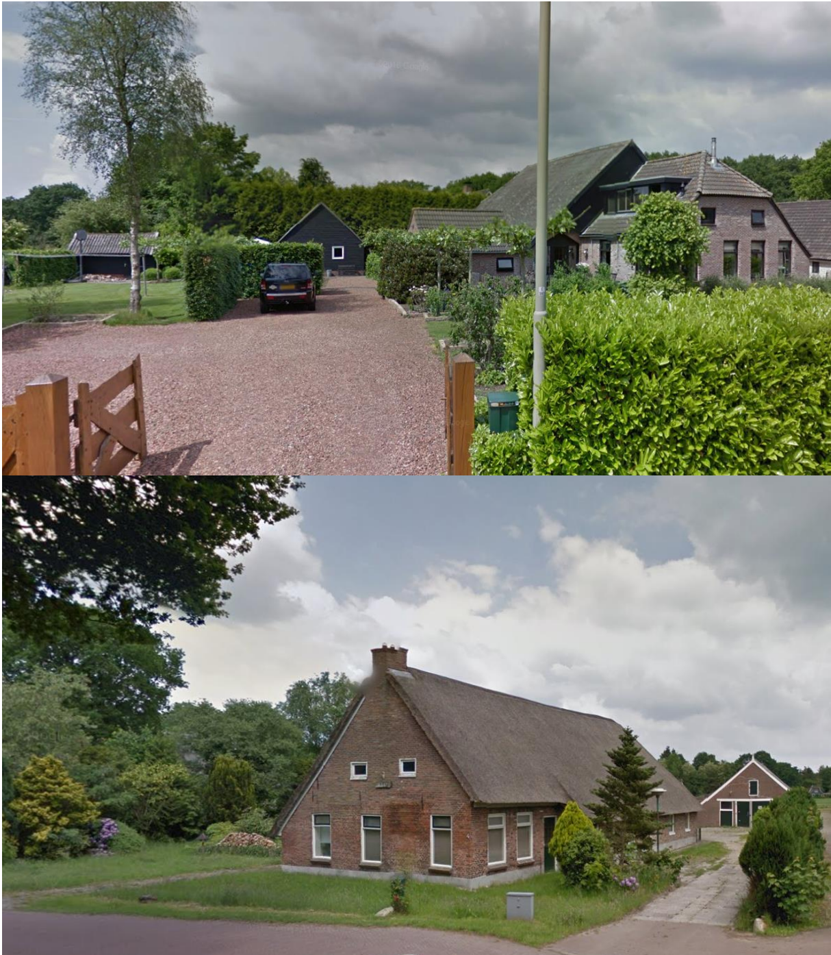
Figuur 4. Erven met een niet authentiek karakter in de dorpskern. De erven hebben veel niet streekeigen elementen zoals coniferen en een laurierhaag. (GoogleMaps)

Deze mooie dorpskern rond de brink met nog veel originele boerenerven staat onder druk doordat er in de loop van de tijd aanpassingen zijn gedaan die niet passen bij het authentieke karakter. Zo zijn er bijvoorbeeld uitheemse en niet streekeigen soorten aangeplant (bijvoorbeeld coniferen en fijnsparrren) en zijn de open ruimten kleiner geworden. Een deel van de erven is omgevormd tot siertuin, soms zijn daarbij aanliggende percelen betrokken. De samenhang tussen de erven en de open ruimten is hierdoor aan het verdwijnen. Verder is plaatselijk sprake van achterstallig onderhoud bij de meer authentieke beplanting zoals oude eiken, lindes, fruitbomen en meidoorhagen. Hieronder zijn enkele voorbeelden te zien van erven met veel niet authentieke onderdelen.