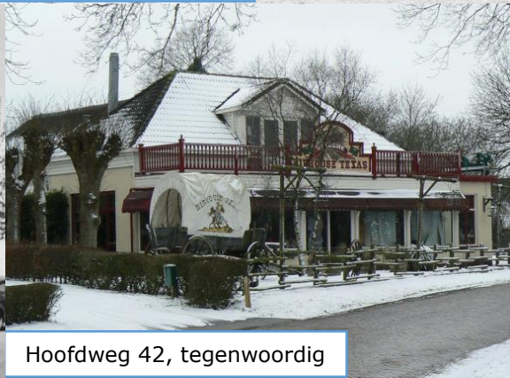
Hoofdweg 42, tegenwoordig