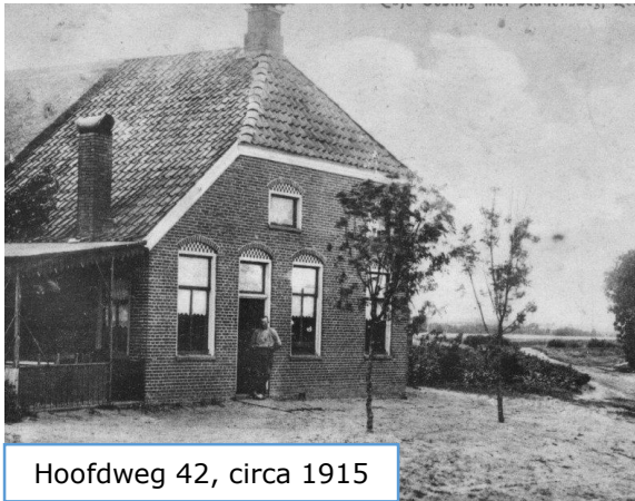
Hoofdweg 42, circa 1915

Veel van de boerderijen uit de 19 e en begin 20 e eeuw bestaan nu nog steeds en geven het dorp zijn karakteristieke aanzicht. Enkele voorbeelden zijn hieronder te zien.