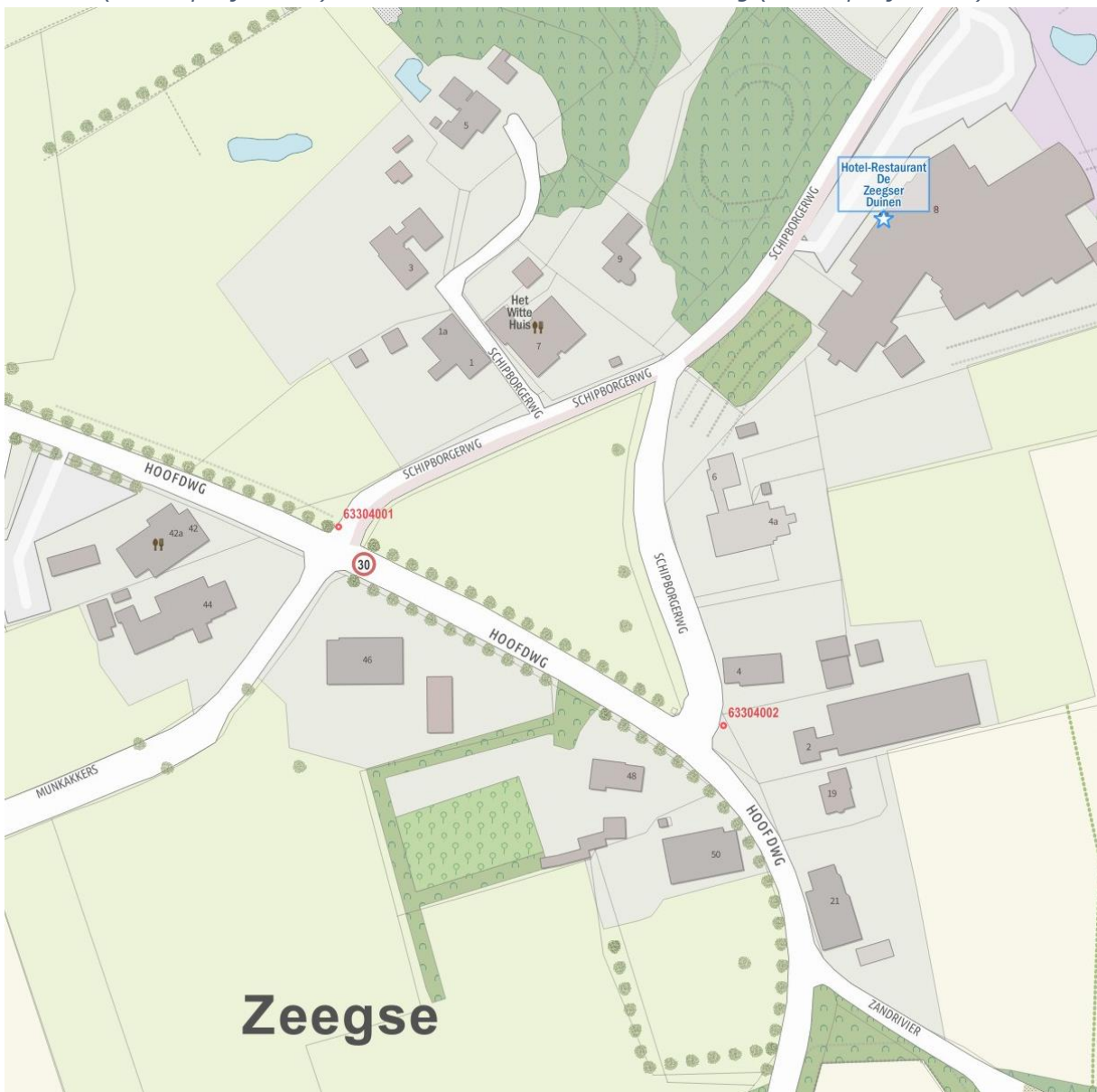
Figuur 2. Topografische weergave van de Brink in 2016