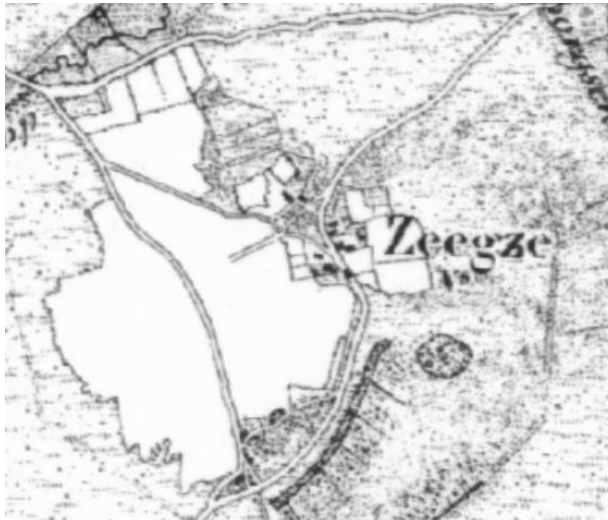
Figuur 2. Zeegse in 1850, met centraal gelegen de brink