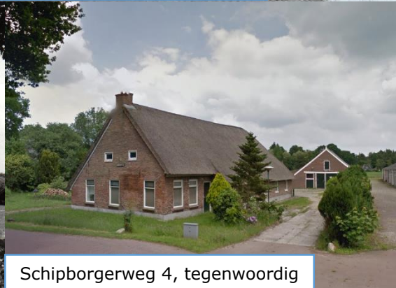
Schipborgerweg 4, tegenwoordig