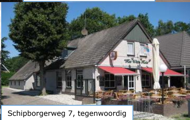
Schipborgerweg 7, tegenwoordig