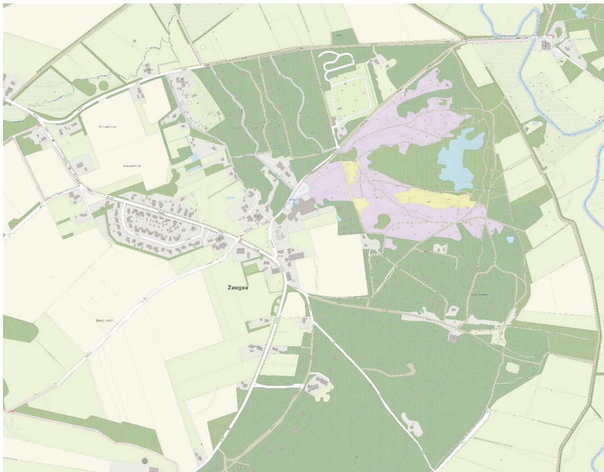
Figuur 1. Topografische kaart 2016

Het esdorp Zeegse maakt onderdeel uit van het nationaal park Drentsche Aa. Vanuit deze doelstelling is er voor de omgeving extra aandacht en bescherming voor de bijzondere natuur en het cultuurlandschap. In het centrum van het dorp bevindt zich een historische brink omgeven door oude boerderijen. Rondom het dorp is een diverse omgeving te vinden met uiteenlopende landschapstypen, zoals een zandverstuiving, natte en droge heide, bos, een beek en een pingeruïne. Deze diversiteit is ook goed terug te zien op de topografische kaart van figuur 1.