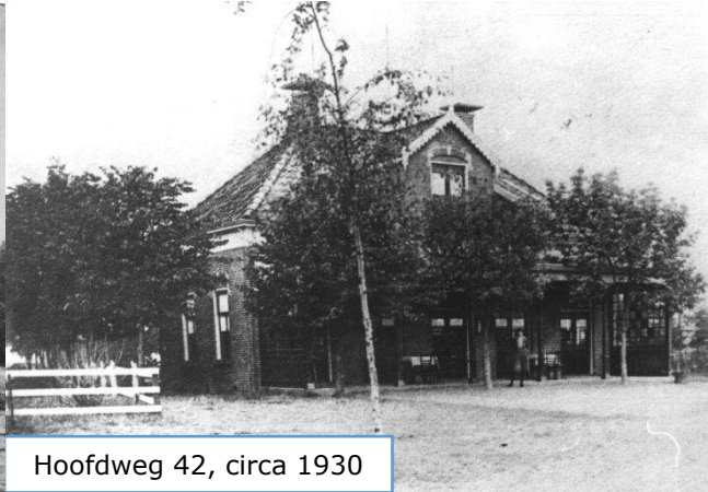
Hoofdweg 42, circa 1930