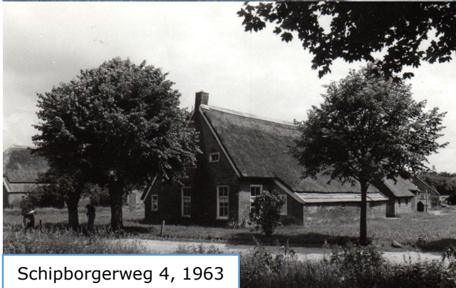
Schipborgerweg 4, 1963