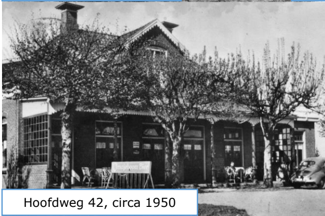
Hoofdweg 42, circa 1950