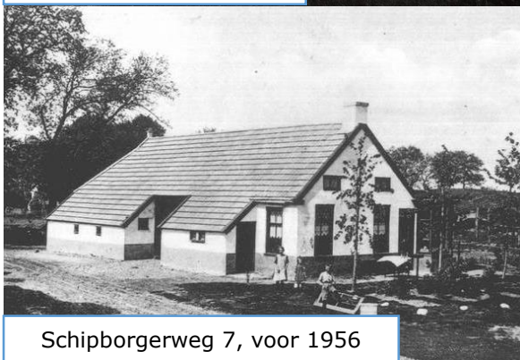
Schipborgerweg 7, voor 1956