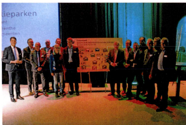
Ondertekening convenant door provincie en gemeenten tijdens het Recreatiecongres op 7 december 2017

In opdracht van het Recreatieschap Drenthe en de provincie Drenthe is een onderzoek uitgevoerd naar de vitaliteit van de verblijfsrecreatie in Drenthe. De resultaten zijn neergelegd in het rapport 'Vitaliteit verblijfsrecreatie Drenthe' en gepresenteerd aan gemeenteraden en Provinciale Staten. Doel van het onderzoek was gedetailleerd in kaart brengen hoe het staat met de vitaliteit van de sector, vanuit het oogpunt van bedrijfsmatig functioneren. Voor het onderzoek is samengewerkt met de Drentse gemeenten en met brancheorganisatie RECRON. Om de vitaliteit van de recreatiesector te vergroten willen provincie, gemeenten en recreatieschap samen met ondernemers aan de slag en gezamenlijk een plan van aanpak opstellen. Hierbij is maatwerk het uitgangspunt. Het gehele onderzoek is te vinden op www.provincie.drenthe.nl/vitalevakantieparken .