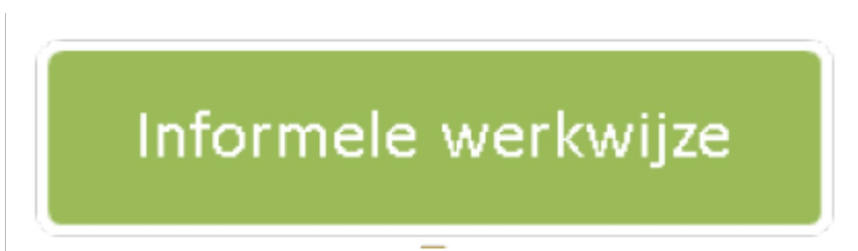
Onvoldoende contrast in pdf