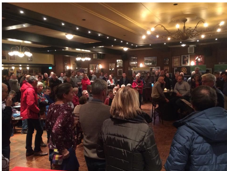
De Bespaarmarkt in Peize

In november en december 2017 zijn de voorbereidingen gestart voor de uitvoering van 8 Bespaarmarkten, 3 keer een Loket op Locatie en 1 experiment. Deze activiteiten zijn in het eerste kwartaal van 2018 uitgevoerd.